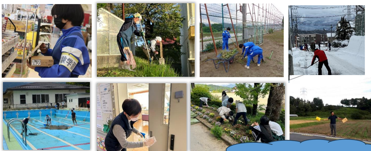
活動のイメージ画像です